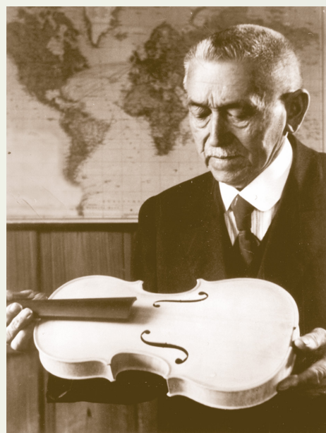
Karl Höfner ca. 1930

Höfner a déménagé dans une nouvelle usine à Haguenau en 1997 et a entretenu sa tradition de développement et d'innovation. Höfner continue à produire des instruments de haute qualité fabriqués à la main telles que les guitares classiques, jazz et basses. Mondialement célèbre pour nos guitares emblématiques, nous nous efforçons de créer de nouvelles idées pour les guitaristes et les bassistes modernes.