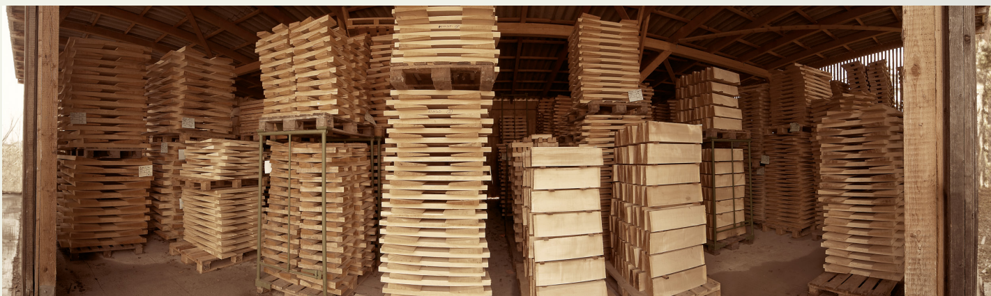
Haguenau heute / today / aujourd'hui