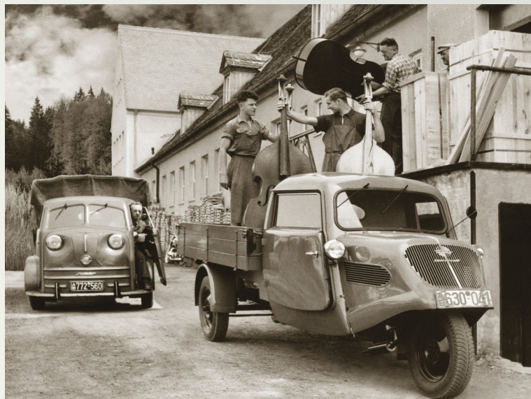
Bubenreuth ca. 1952