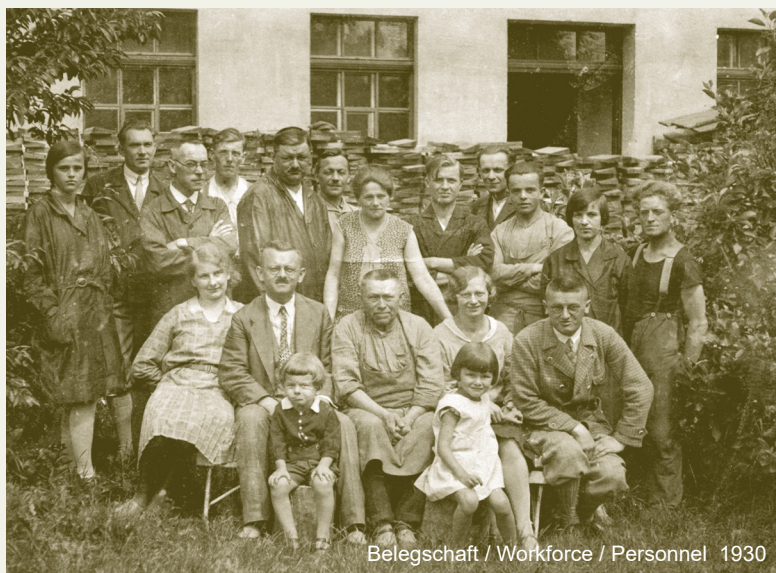
Belegschaft / Workforce / Personnel 1930

Vom Geigenbaumeister Karl Höfner 1887 in Schönbach gegründet, entwickelte sich das Unternehmen zu Deutschlands größtem Hersteller auf dem Gebiet des Streich- und Zupfinstrumentenbaus. Handwerkliches Können und unternehmerische Initiative rechtfertigten schon vor dem ersten Weltkrieg einen Ruf, der weit über die Grenzen Deutschlands hinausreichte. So wurde Karl Höfner 1907 damit betraut, die Geige des sächsischen Königs zu reparieren, was dem Meister trefflich gelang - zur vollsten Zufriedenheit des Monarchen.